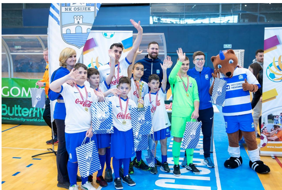
NK Osijek sudjelovao je na 22. turniru Special Power League

Jedan od projekata u kojima NK Osijek sudjeluje od samih začetaka je Special Power League, projekt pokrenut na inicijativu Udruge Akademija zdravog življenja, a čija ideja jest motiviranje djece s teškoćama u razvoju da se kroz sportske aktivnosti aktivno integriraju u društvo. Projekt je osmišljen temeljem činjenice da djeca s teškoćama u razvoju nemaju mogućnosti adekvatnog bavljenja sportom. Projekt se zasniva na izvannastavnom bavljenju sportom za djecu s teškoćama u razvoju te mogućnost uključivanja u projekt i djece koja pohađaju Centre za odgoj i obrazovanje, ali i djece koja su uključena u sustav redovnog školovanja. Projekt je zamišljen kao cjelogodišnje bavljenje sportom za koje bi klubovi koji su uključeni u projekt osiguravali trenere, a Akademija zdravog življenja i partneri podršku u stručnom osoblju te organizaciji "Lige".